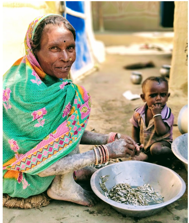
Håndtering af madvarer

På listen over de hyppigste henvendelsesårsager ser vi fortsat forebyggelige sygdomme, som især skyldes dårlig hygiejne og mangelfuld håndtering af vand og madvarer.