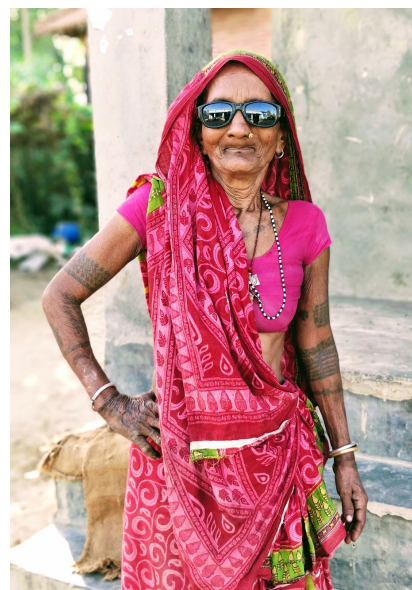
Solbriller uddelt til kvinde fra Belhi

Landsbypatienterne blev efter undersøgelsen henvist til operation for grå stær på øjenhospitalet i Janakpur til meget reduceret pris. I alt 61 patienter blev opereret.